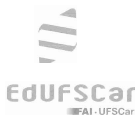
Figura1. Ilustração representativa para adesivo de porta, com exemplo do que foi aplicado ao veículo adquirido pela Editora.

Configuração Visual: como definido na figura abaixo.