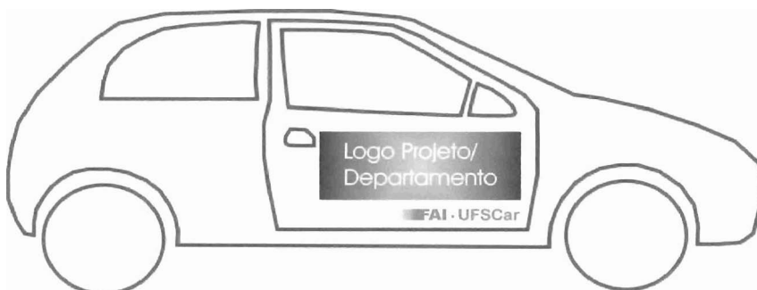
Figura 2. Ilustração representativa de localização para adesivo de porta. No espaço cinza entende-se como espaço reservado para a logomarca do projeto.